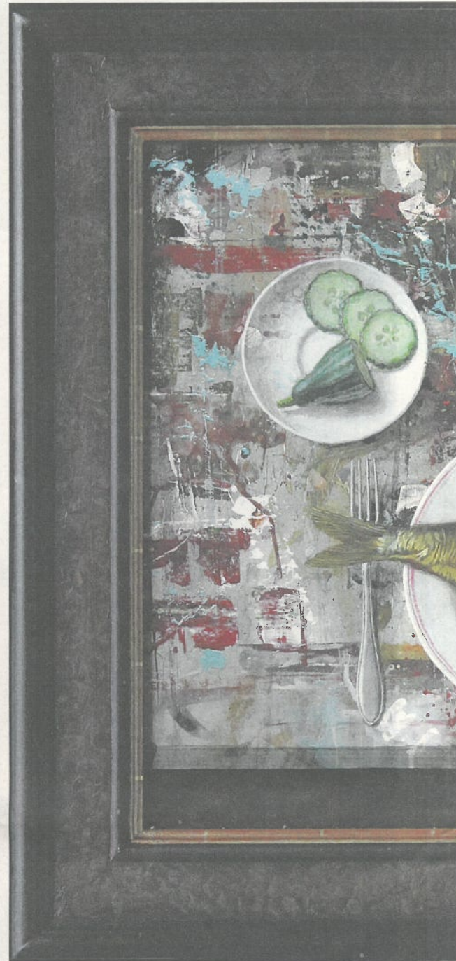
Bokking, melk en komkommer, 60x50, acryl op paneel.

zoveel ervaring heb in het schilderen van stillevens, dat ik zo'n kannetje of iets dergelijks gewoon verzin. Alleen bij bijzondere materialen of effecten is het wel handig om een concreet voorwerp voorhanden te hebben, bijvoorbeeld een vis of een opengesneden tomaatje om de glans goed te pakken te krijgen of een glas vanwege de transparantie. Maar het komt voor dat ik een heel stilleven schilder zonder ook maar één van de geschilderde voorwerpen ook echt uitgestald te hebben. Zo is een beeld dat naar de werkelijkheid geschilderd lijkt, in feite een fantasiebeeld.'