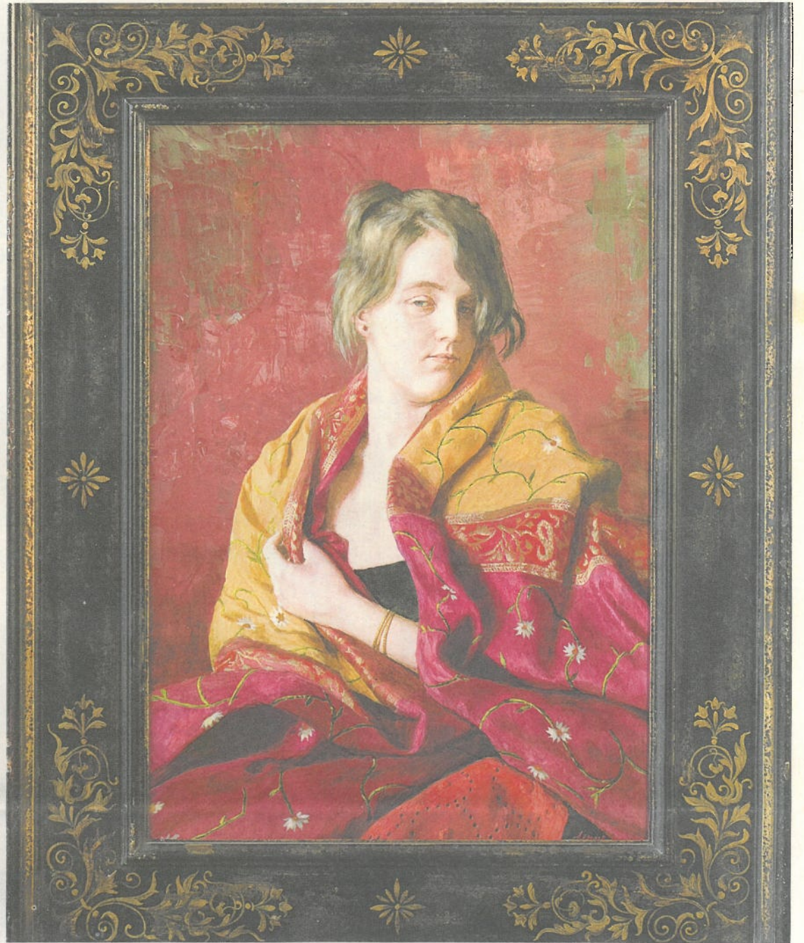
Portret jonge vrouw, 50x70, acryl op paneel.

Ook gebruikt hij textiel als onder- en achtergrond. Realistischer kan bijna niet. Dan gaat hij uit van het bestaande patroon in de stof, bijvoorbeeld een Paisleymotief, zij het dat hij vaak de kleuren verandert. Door de fel gekleurde patronen op het textiel