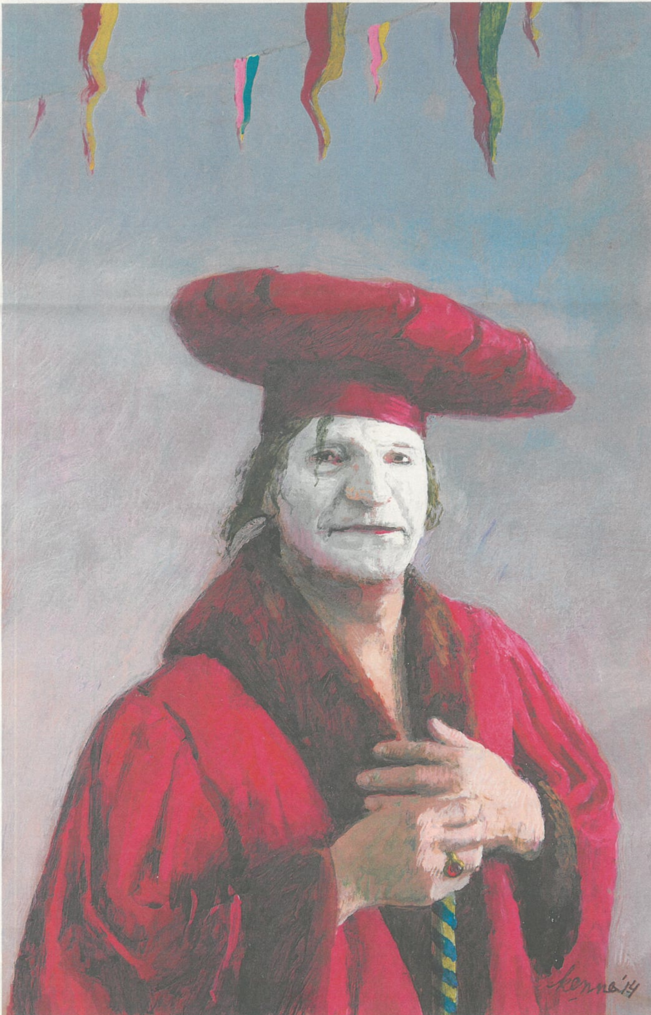
Decaan, 35x25, acryl op paneel.

'Ik heb meestal bij een stilleven al tevoren een duidelijk idee van waar ik naartoe wil, een concept. Ik zie bijvoorbeeld een horizontale beweging voor me, waarin potten die rechtop staan dat horizontale doorbreken en daarnaast moet dan aan weerszijden een bord komen vanwege de symmetrie. Ik gebruik de voorwerpen puur als elementen voor de compositie. Door mijn hoofd gaan gedachten als: nu heb ik een wit hoog dingetje nodig. Het is dan wel plezierig dat ik inmiddels